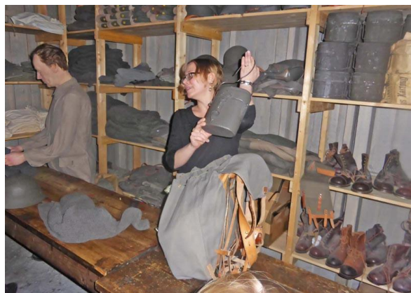
Visning av Armémuseum 2016

Här blev lite utrymme över, som vi kan fylla med bilder från tidigare träffar i föreningen.