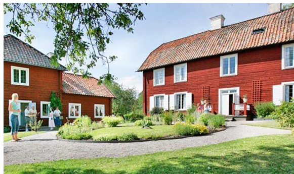
Besök vid Linnés Hammarby 2019