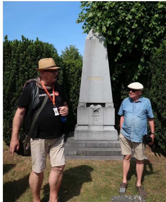
Två seniorer vid Alfred Nobels grav