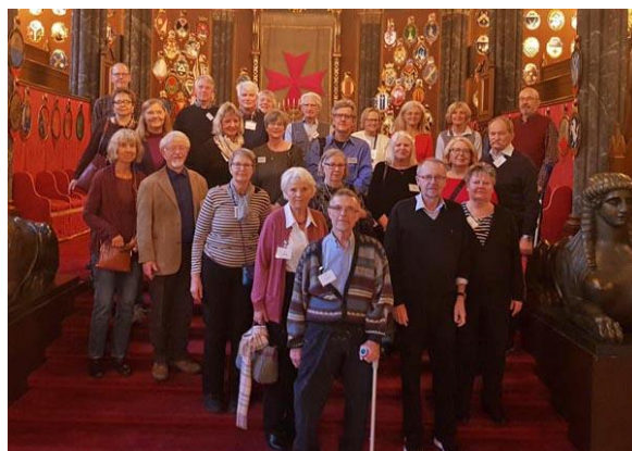
Samling i Bååtska Palatset 2021