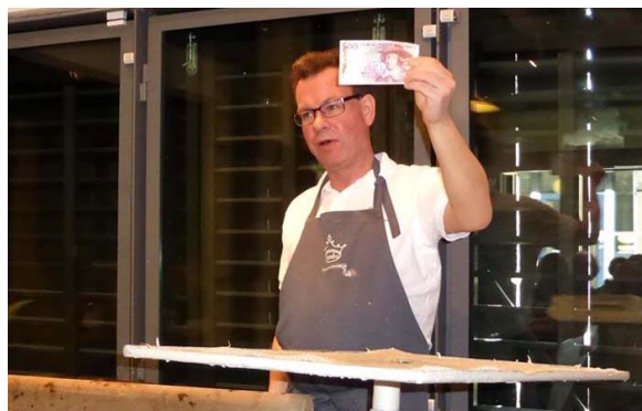
Besök i Tumba Bruksmuseum 2015